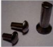
DIN 124 DIN 302 DIN 660 DIN 661 DIN 662 DIN 674